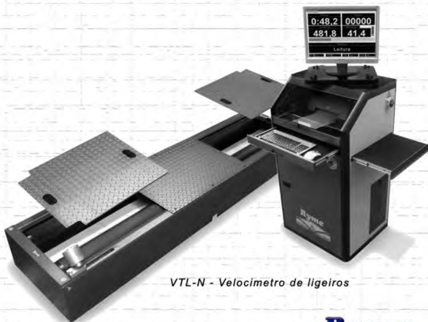
VTL-N - Velocímetro de ligeiros